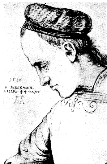
1500-talsmålaren och tecknaren Hans Burgmair.

av en förgrämd åldring. Georg von Frundsberg, fälthövitsmannen som vi alla känna tack vare hans vänliga axelklapp åt Luther i Worms, ser sannerligen allt annat än munter ut på det samtida målade porträttet. Härmästaren Walter von Plettenberg tyckes skåda in i en avgrund av fasa, i en värld som faller sönder, då den tyskbaltiska ordensstatens gränser hota att brista samman under trycket från öster. Själva den trygge riddar Görz von Berlichingen blickar på gravhällen med vidöppna ögon som såge de en förstnande skräcksyn. Barockens furstar skina blanka och feta, nöjda med »den bästa av världar». Men med Fredrik den Store på hans gamla dagar — en byst från 1786 — börjar grubblet och den molande ångesten på nytt. Detta var furstar och väldige! Hur skall det då se ut bland tänkare och andliga ledare? Man minnes Luther som munk på Lucas Cranachs kopparstick från 1520 med hans uttryck av nästan olidlig spänning i det knotiga, osköna ansiktet, man förstår inför Jacob Böhmes gestalt att han fått betala priset för sina mystiska insikter. Och Schopenhauers huvud, den gamles som den unges, svara till hans pessimistiska filosofi.