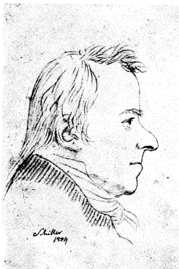
Schiller enligt Schadows blyerts-teckning.

Ur den utvärtes och ytliga skönhetens synpunkt imponerar kanske detta tyska panteon icke synnerligt på den, som ser till