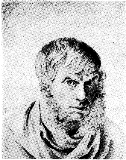
Målaren Kaspar David Friedrich.

Eichendorff, Hoffmann verka på de här återgivna porträtten som fångna i en ångestdröm. Bland konstnärerna finner man visserligen en del trygga hantverksmän och mästare i sitt fack som Peter Vischer, Hans Holbein, Balthasar Neumann och Schadow, som Waldmüller och Menzel. Men som kontraster till dem den långa skaran av tungsinta pilgrimer och kämpar, från Adam Krafft och Dürer till Kaspar David Friedrich och Philipp Otto Runge, Anselm Feuerbach och Hans von Marées. Till och med under den glorrika och glada senbarockens tid mellan 1700 och 1750, då det i andra länder hörde till att konstnärerna, när de porträtterades, skulle framträda i leende självbelåtenhet, möta vi i bilder som Mannheimskulptören Paul Egells porträtt, målat av Cosmas Damian Asam, samme Cosmas Damian Asams av brodern Egid Quirin utförda porträtt, som Raphael Donner på Schmutzers kopparstick efter Paul Troger eller Ignatz Günthers porträtt, målat av Knoller, en egendomlig stämning av grubbel och oro.