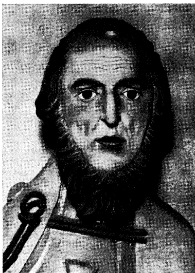
Walter von Plettenberg.