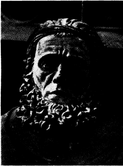
Bildhuggaren Adam Krafft.