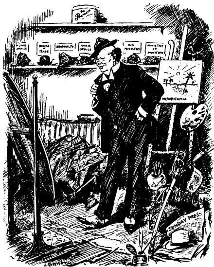
HATS THAT HAVE HELPED ME. Mr. WINSTON CHURCHILL ( trying on Colonial headgear ). - VERY BECOMING—BUT ON THE SMALL SIDE, AS USUAL.

Churchill var nu en isolerad man. Han stod utanför de traditionella partierna. Men hans opposition mot socialismen förenade honom med de konservativa. Förgäves sökte han under nära tvenne år efter en valkrets och ett mandat. År 1924 besegrar han City och blir Baldwins finansminister. Det