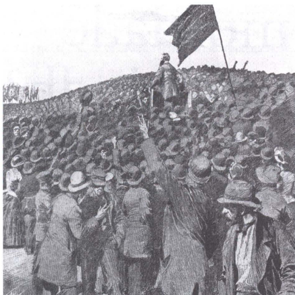
Ideologierna är fortfarande livskraftiga i det nya Europa. Här den stora 1 maj-demonstrationen på Gärdet i Stockholm, ur Ny Illustrerad Tidning, 1890.

ofta i arbetsgrupper som kan hantera allt från ideologi till valstrategi. Problem finns naturligtvis då kompromisser i en stor medlemskrets kan leda fram till resultat som passar flera medlemspartier illa. Massmedia gillar att i europeiska dokument finna förgripligheter som på hemmaplan kan ställa till problem för ett medlemsparti. Olika åsikter föreligger också i vilken utsträckning "Europapartierna" skall gå utöver erfarenhetsutbyte och bedriva en egen valrörelse inför EP-valet och därmed blanda sig i de nationella partiernas strävanden.