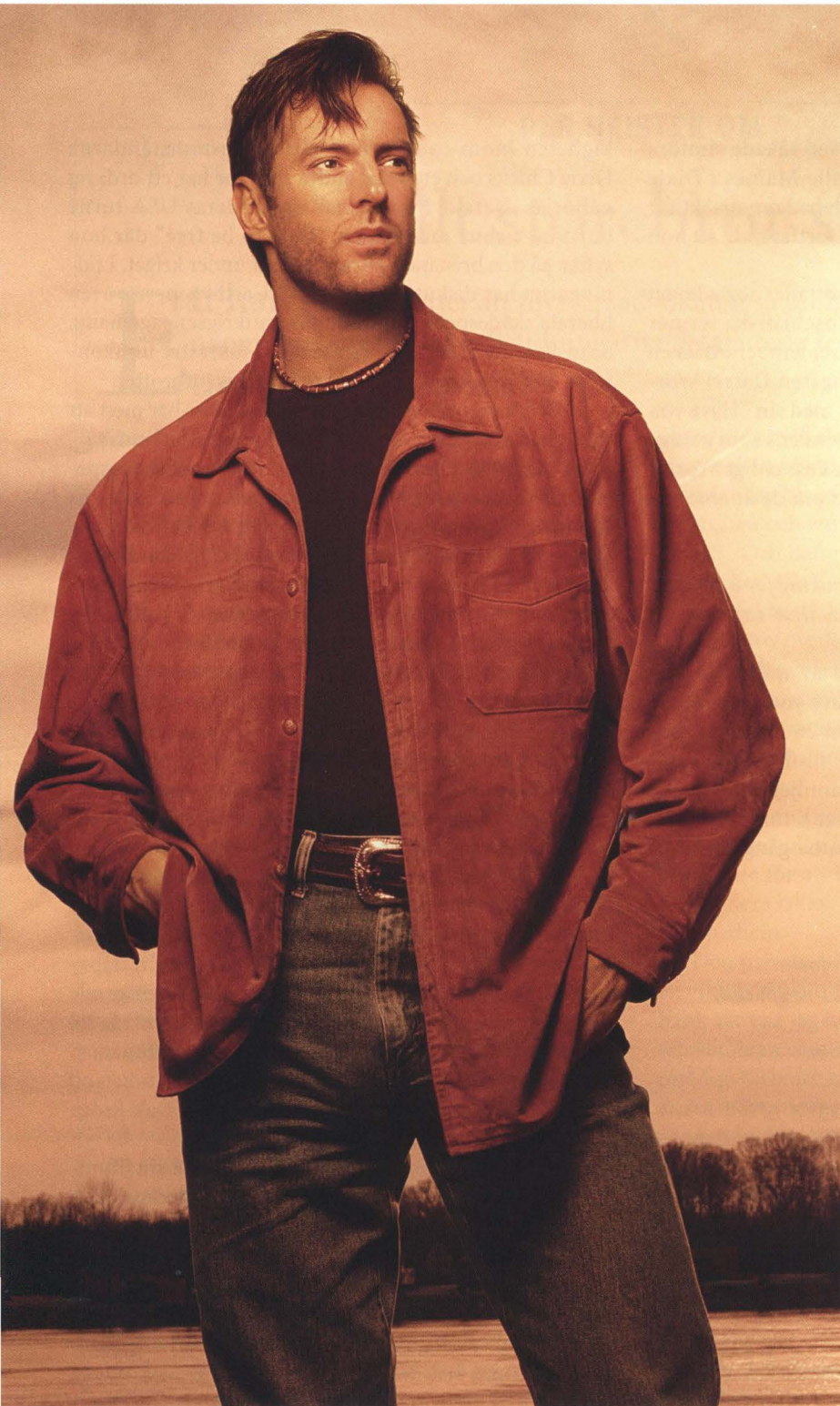
Darryl Worley blev militärens kelgris efter sin listetta "Have you forgotten?"

countryfolket det gammeldemokratiska gardet, men efter 60-talet sögs de upp av den nya republikanska högern. Man kan under 70-talet se en allians mellan countryn och motståndet mot de liberala demokrater som under Vietnam-åren rökte gräs, brände BH: n och vanärade både familjen och flaggan. Merle Haggards jättehitt "Okie from Muskogee" drev med den tidens nya påfund och