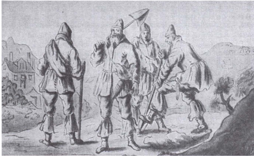
Vad skulle stormaktstidens bönder ha sagt om Fredrik Reinfeldts tal på Pridefestivalen?

Vad som är karakteristiskt för den senaste långa framgångsvågen, och gör den unik, är att etablerandet av bor-