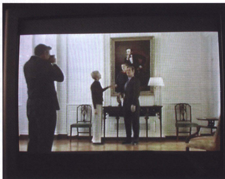
Presidenten Jack Stanton (John Travolta) har "diskuterat skolfrågor" med den lokala skolnämndsordföranden i "Spelets regler"

"The president has arrived to the Congress!" ropas det efter bästa Elvis-manér ut i högtalarsystemet. Det är dags för filmens avgörande scen. Presidenten håller ett långt och känsligt anförande som avslutas i klassisk Capra-anda. Och vi kan än en gång höra Jimmy Stewart i Mr Smith goes to Washington utmana sina motståndare: "Mr Ryan, ni kan gå ifrån mig och från denna församling men ni undkommer inte det amerikanska folkets vilja!"