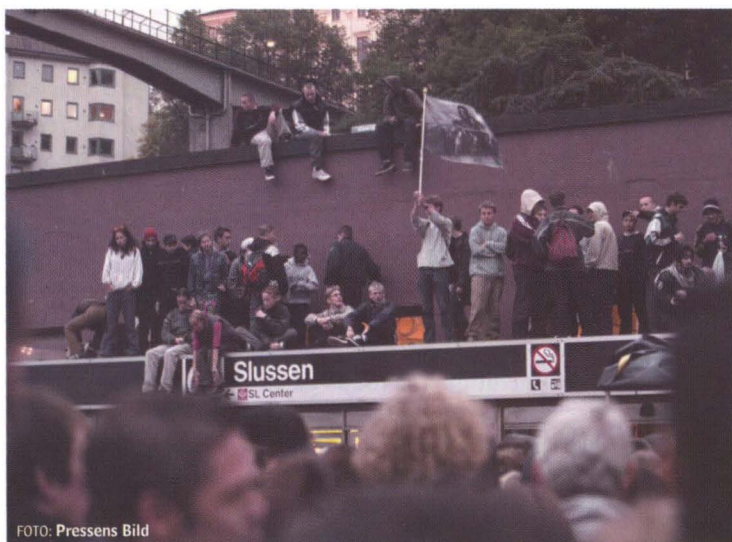
Reclaim the City. Kidsen ska ta tillbaka staden.

att den förändrade omvärld som post-68-orna vuxit upp i också påverkat deras attityder, till arbete, fritid, samhällsliv och till mer existentiella frågor. Hans bild av att klyftan mellan generationerna skulle vara närmast omöjlig att överbrygga är en karikatyr, men det finns tecken som tyder på att det främlingskap han beskriver inte kan avfärdas bara som en generationskonflikt om de bäst ansedda och betalda jobben. Vi kan i dag se tecken på en djupare värderingsförskjutning, där skiljelinjerna inte alltid exakt följer generationsgränserna. Denna brytningstid uppvisar vissa drag som påminner om 1700-talets slut, då de framflyttande romantiska strömningarna utmanade upplysningstidens förnuftstro.