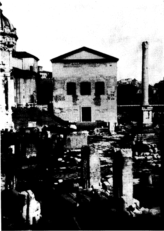
Fig. 2. Senantik på Forum Romanum. — Senatens Curia och Forums senaste monument, Fokaskolonnen, ställa emot varandra 300-talets tidstypiska arkitektur och den begynnande medeltidens bruk av klassiska kolonner.