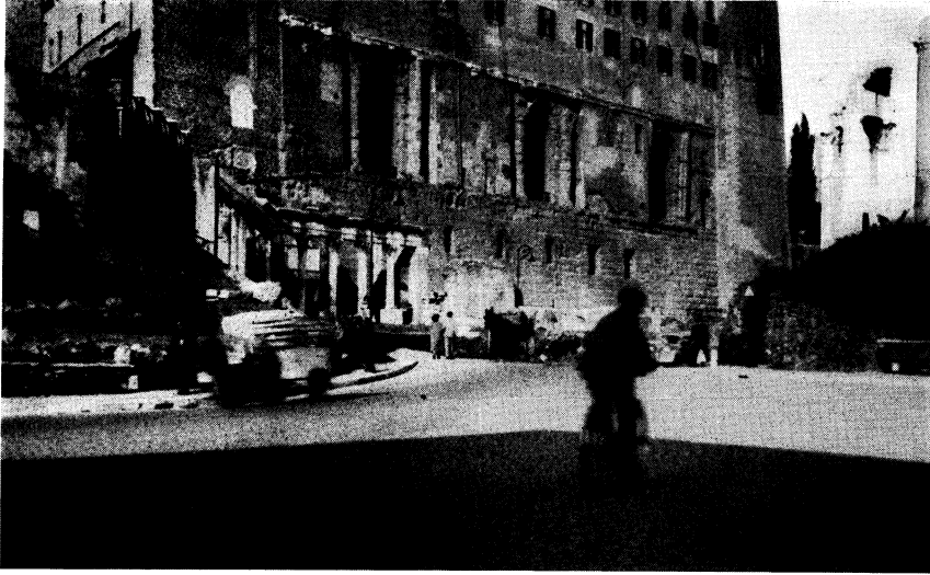
Fig. 1. Från republikens Rom. — Det romerska riksarkivet (Tabularium) med nyligen öppnade valvbågar i arkadfasaden mot Forum Romanum.