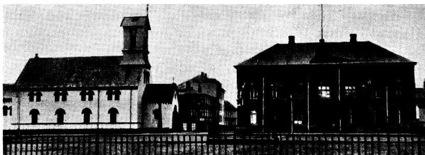
Domkyrkan och alltingshuset i Reykjavik.

Men nu foreligger der altsaa fra Islands Side klare Tilkendegivelser af, at Island fortsat føler nordisk og ikke paa nogen Maade ønsker en Ændring i sit nordiske Broderskabsforhold. Og det maa hilses med Tilfredshed i de andre nordiske Lande, hvis det saaledes kan fastslaas, at den islandske Selvstændighedstrang, der fuldtud maa anerkendes, ikke slaar noget Skaar i Venskabet og Samhørigheden mellem de fem nordiske Lande — et Venskab, som i Fremtiden kan faa langt videre Betydning end nogensinde før.