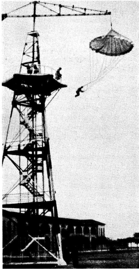
Fallskärmshopp från övningstorn.

Före igångsättandet av ett landsättningsföretag måste den anfallande inhämta noggranna underrettelser rörande bl. a. själva platsen för landsättningen. Dylika upplysningar erhållas dels genom flygspaning, dels genom spioneri. Ofta kan det bli nödvändigt att omedelbart före landsättningen nedsläppa enstaka patruller för att t. ex. undersöka markbeskaffenheten, men ett sådant tillvägagångssätt är dock endast möjligt därest god tid står till förfogande. Vidare är det av vikt att vid tidpunkten för landsättningen äga lokalt herravälde i luften, varför transportförbanden vid behov och då så är möjligt eskorteras av jaktförband. Allteftersom förbanden passera landsättningsplatsen verkställas uthoppen. Dessa företagas så samtidigt som möjligt för att fallskärmstruppen icke skall spridas ut över en alltför stor yta och truppens samling därigenom försvåras. Efter samlingen rycker fallskärmstruppen fram och tager anbefalld terräng, som hålles till dess att huvudstyrkan blivit landsatt.