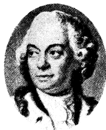
A. J. von Höpken

N. F. Gyldenstolpe J. O. Wallin A. Fryxell H. Forssell K. N. D. Bildt B. Wedberg