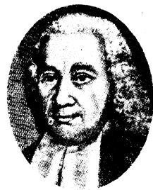
O. Celsius d. y.