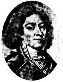
K. G. af Leopold

S. Grubbe I. Hwasser K. V. A. Strandberg V. Rydberg V. Rudin N. Söderblom T. Andre